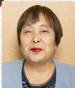
相続コンサルティング部

私は、毎日お弁当を持参しています。普通のお弁当箱は使わず、味が混ざらない様、小さなタッパーにいろいろおかずを入れてきます。ゴハン、味噌汁、おしんこ、果物等がタッパーの数は、6〜7個に足りります。暖かくして食べたものは、電子レンジでチンして食べています。1日の内で一番充実した食事です。